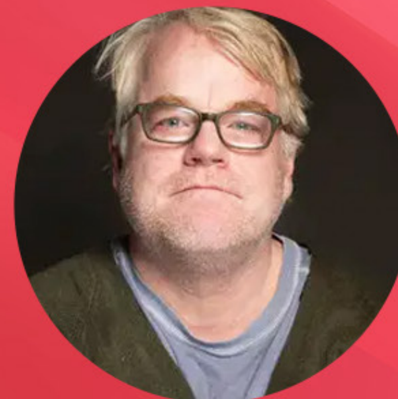
Philip Seymour Hoffman